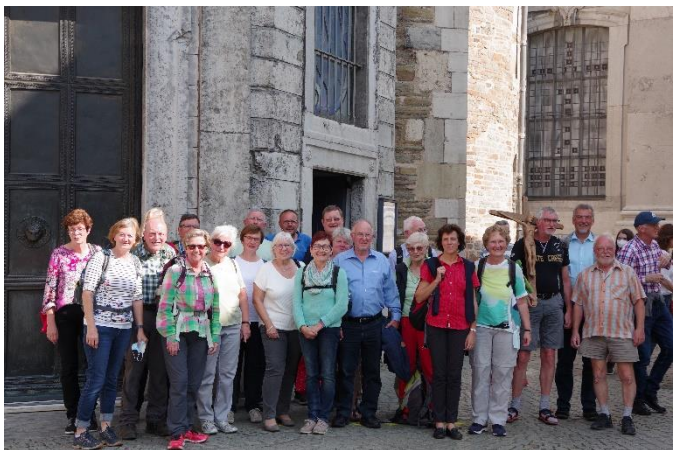
Vor dem Aachener Dom.