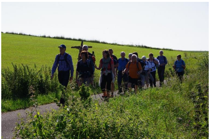
Pilgergruppe der 9. Grafschafter Fußwallfahrt 2021 auf dem Weg nach Aachen.

Liebe Pilgerfreunde, herzlich möchte ich euch und Sie wieder einladen zur diesjährigen Fußwallfahrt. Um besser planen zu können, würde ich mich in jedem Fall – auch bei Nicht-Teilnahme – sehr über eine zeitnahe Rückmeldung freuen (telefonisch oder per E-Mail). Herzliche Pilgergrüße Joachim Opfer